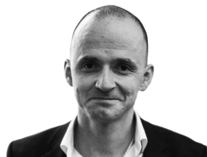
Олександр Лінчевський, заступник Міністра охорони здоров'я України

Держава більше не імітує і не змушує це робити лікарів: передатестаційний цикл необов'язковий, а самозвіт лікаря та співбесіду з атестаційною комісією скасували. Зайва бюрократія у вигляді самозвітів про професійну діяльність за останні три роки змінилася на індивідуальне освітнє портфоліо лише на одну сторінку, яке містить перелік перелік курсів та навчальних конференцій, які лікар відвідав упродовж року. Тепер держава очікує, що лікар проходитиме той чи інший